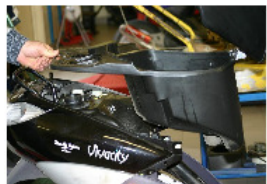
RETIRER LE COFFRE ET LA SELLE.