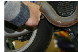
DÉPOSE DE LA VIS INFÉRIEURE (BTR DE 8) FIXATION DU POT D'ÉCHAPEMENT AU CARTER.