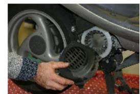
RETIRER LE CACHE ALLUMAGE.