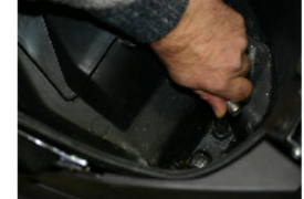
RETIRER LES 2 ÉCROUS DU FOND DE COFFRE TOUJOURS AVEC LA MÊME CLÉ À PIPE.