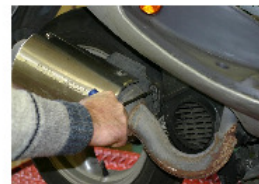
DÉPOSE DE LA VIS SUPÉRIEURE (BTR DE 8) FIXATION DU POT D'ÉCHAPEMENT AU CARTER.