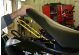
OUVRIRE LA SELLE.

La vitesse des 2 roues de 50 cc est limitée à 45 km/h sur le réseau routier Européen. Pour respecter cette législation, brancher le câble Bleu à la masse et votre véhicule sera régulé à 45 km/h.