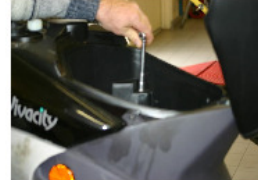
RETIRER LES 2 ÉCROUS SUPÉRIEURS DU COFFRE À L'AIDE D'UNE CLÉ À PIPE DE 10 mm.