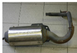
DÉPOSE DU POT D'ÉCHAPEMENT.