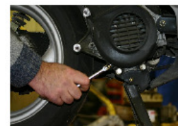
À L'AIDE D'UNE CLÉ À PIPE DE 8 mm OU À L'AIDE D'UNE CLÉ À CLIQUET AVEC RALLONGE ET DOUILLE DE 8mm .