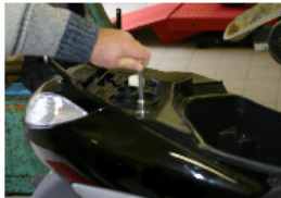
UNIQUEMENT SUR TREKKERS ET SPEEDFIGHT RETIRER LES VIS DE 6 SUPÉRIEURS DU COFFRE À L'AIDE DE LA CLÉ À PIPE DE 10 mm.