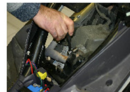
DESSERRER ET DÉPOSER LES VIS DE FIXATION POT AU CYLINDRE À L'AIDE D'UN CLIQUET ET DOUILLE DE 10.