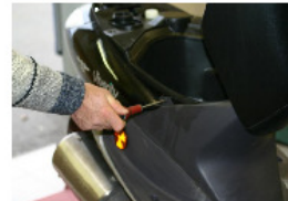
RETIRER LES 2 VIS SUPÉRIEURS DU CACHE BATTERIE À L'AIDE D'UNE CLÉ TORX DE 20 OU D'UN TOURNEVIS PLAT.