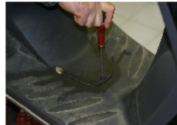
RETIRER LA VIS INFÉRIEURE DU CACHE BATTERIE À L'AIDE D'UNE CLÉ TORX DE 20 OU D'UN TOURNEVIS PLAT.