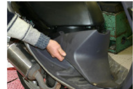
POUR RETIRER LE CACHE, BAISSER LA SELLE ET DÉCLIPSER LES CÔTÉS EN FAISANT BASCULER VERS L'AVANT.