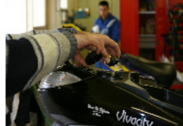
RETIRER LES BOUCHONS DES RÉSERVOIRS D'HUILE ET D'ESSENCE.